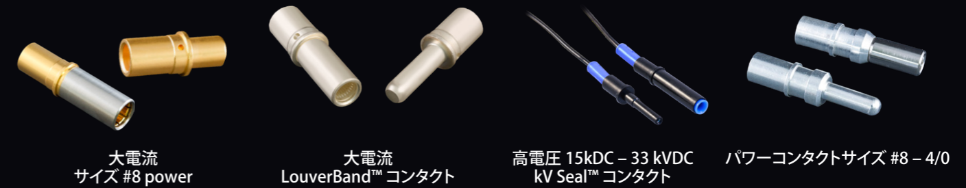
大電流 サイズ #8 power