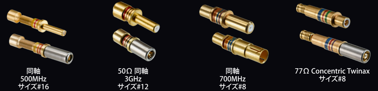
同軸 500MHz サイズ#16