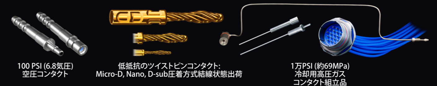
100 PSI (6.8気圧) 空圧コネクタ