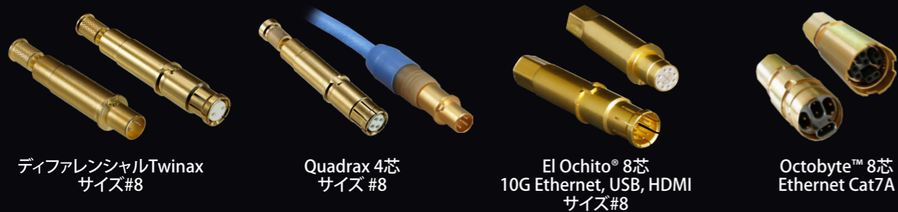
ディファレンシャルTwinax サイズ#8