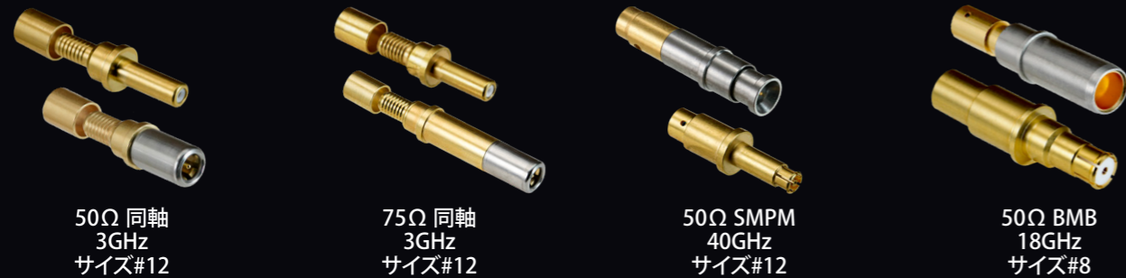
50Ω 同軸 3GHz サイズ#12