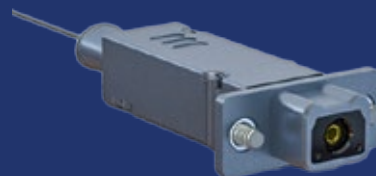
792シリーズ角形コネクタ