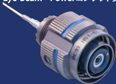
Glenair D38999 SuperNine®