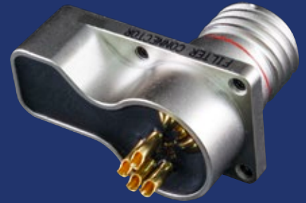
D38999 サイドカー省スペース設計