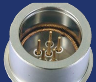
特注QDコネクタ 半田フリー接合コンタクト