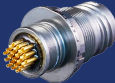
Mighty Mouse 805 シリーズ ジャムナットレセプタクル ソルダーカップ