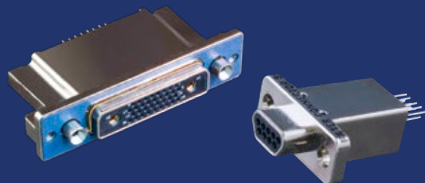
Micro-Dと79 シリーズ角形コネクタにも EMIフィルターやEMP対応可