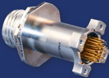
ロングシェル構造 スタンドオフ形状