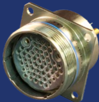
MIL-DTL-83723 シリーズIII EMPコネクタ