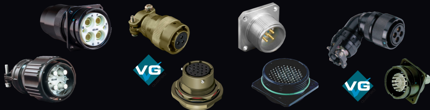
Super ITS - 921シリーズ 高温・高電流容量 多極コネクタ