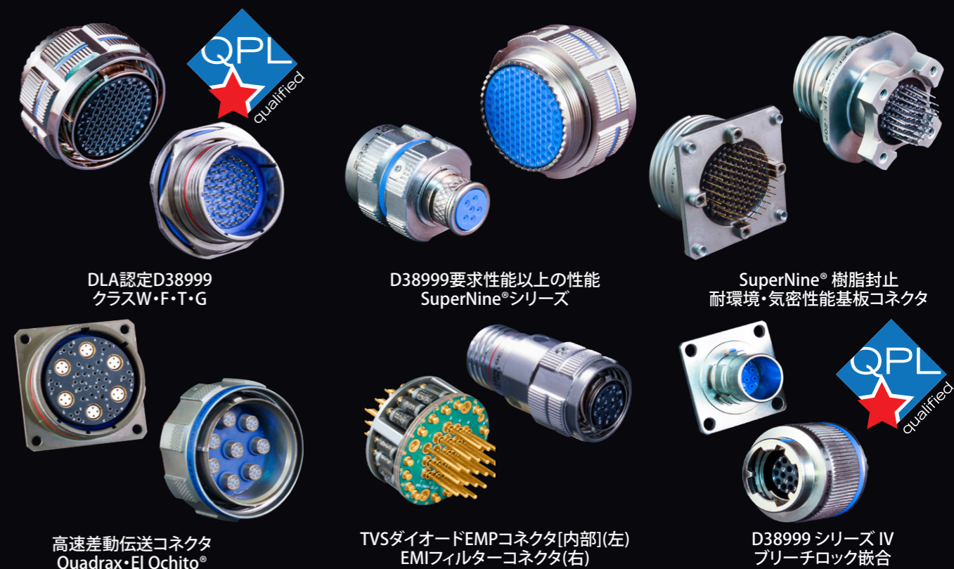
DLA認定D38999 クラスW・F・T・G