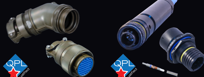
M28840 電気コネクタ・バックシェル等