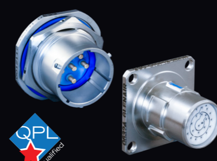
MIL-DTL-38999 シリーズ I・II・III・IV ガラス封止ハーメチック