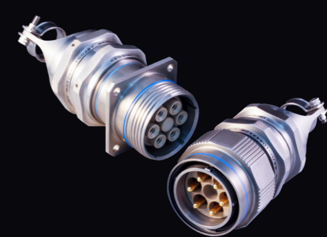
PowerLoad™ 航空機電力分配コネクタ 補助発電機・IDG・eVTOL電動推進