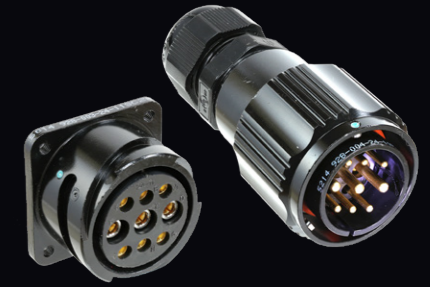
バラスト・ヘッド接続 パヨネットロック嵌合