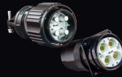
5015最上位モデル 耐熱180°C仕様・高電流容量 樹脂インサート・コンタクト保持クリップ内蔵