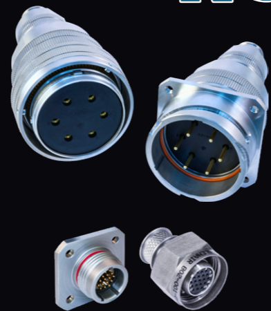
SuperNG (上)・ Mighty Mouse NG (下) 格納容器エリア (クラス1E)・ 10CFR50 Appendix B