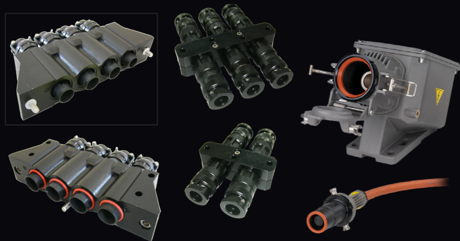
IRTシリーズ 鉄道モータ用 多極コネクタ