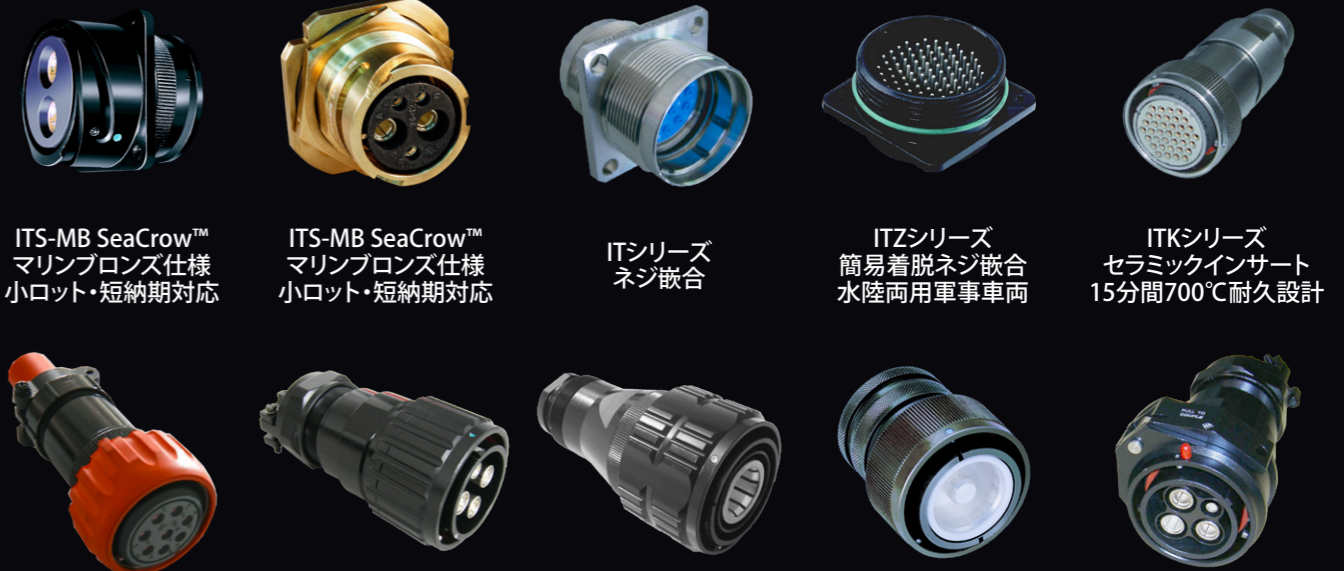
ITS-MB SeaCrow™ マリブロンズ仕様 小ロット・短納期対応