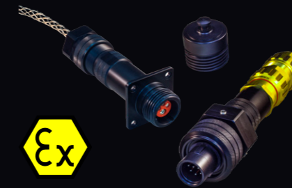
IECEx / ATEX 認証取得 グループIIc・温度クラスT6 / T5・ ゾーン1 / ゾーン2