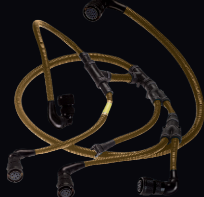
鉄道用多分岐ハーネス