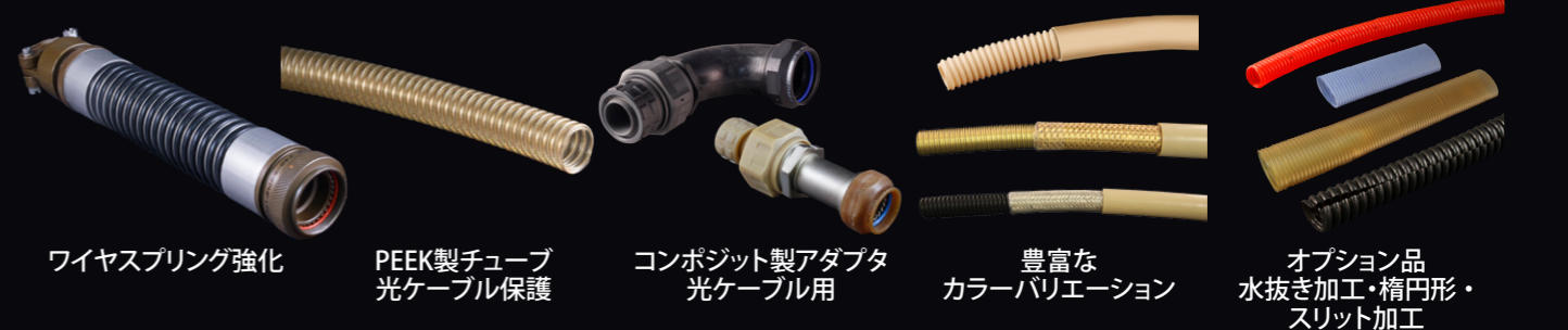
ワイヤスプリング強化