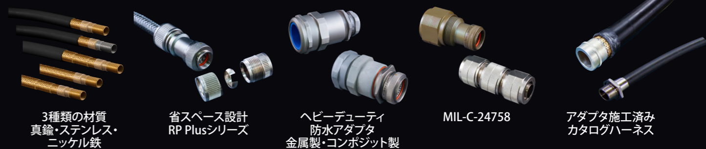
3種類の材質 真鍮・ステンレス・ ニッケル鉄