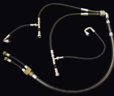
航空機用ハーネス 金属製コルゲートチューブ使用