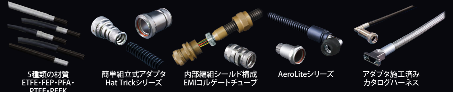
5種類の材質 ETFE・FEP・PFA・ PTFE・PEEK