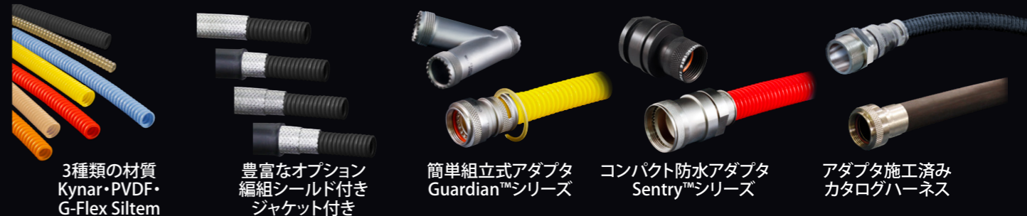
3種類の材質 Kynar・PVDF・ G-Flex Siltem