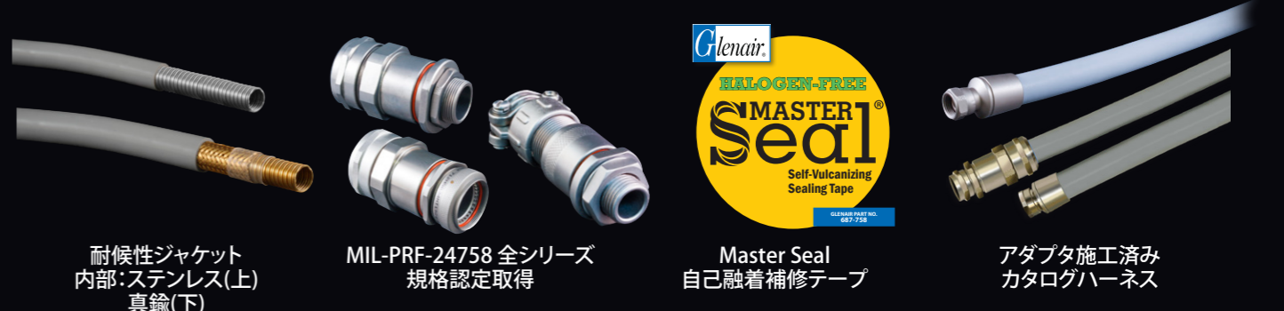
耐候性ジャケット 内部：ステンレス(上) 真鍮(下)